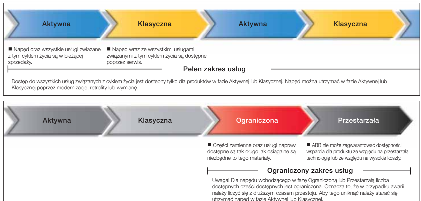
ABB kieruje się czterofazowym modelem zarządzania cyklem życia napędów, w celu wsparcia i pomocy dla klienta oraz zwiększenia efektywności wykorzystania napędów.

Przykłady usług związanych z cyklem życia: dobór i wymiarowanie, instalacja i uruchomienie, szkolenia, wsparcie techniczne, przeglądy, dostawa części zamiennych, naprawa oraz wymiana.